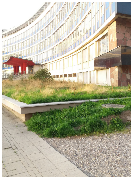
Faculté de droit de Strasbourg