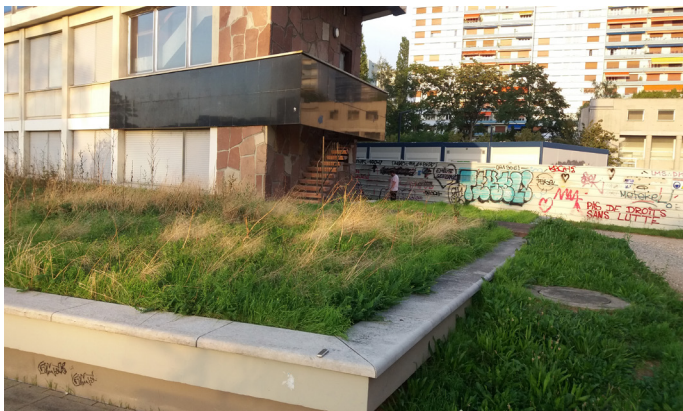
Faculté de droit de Strasbourg