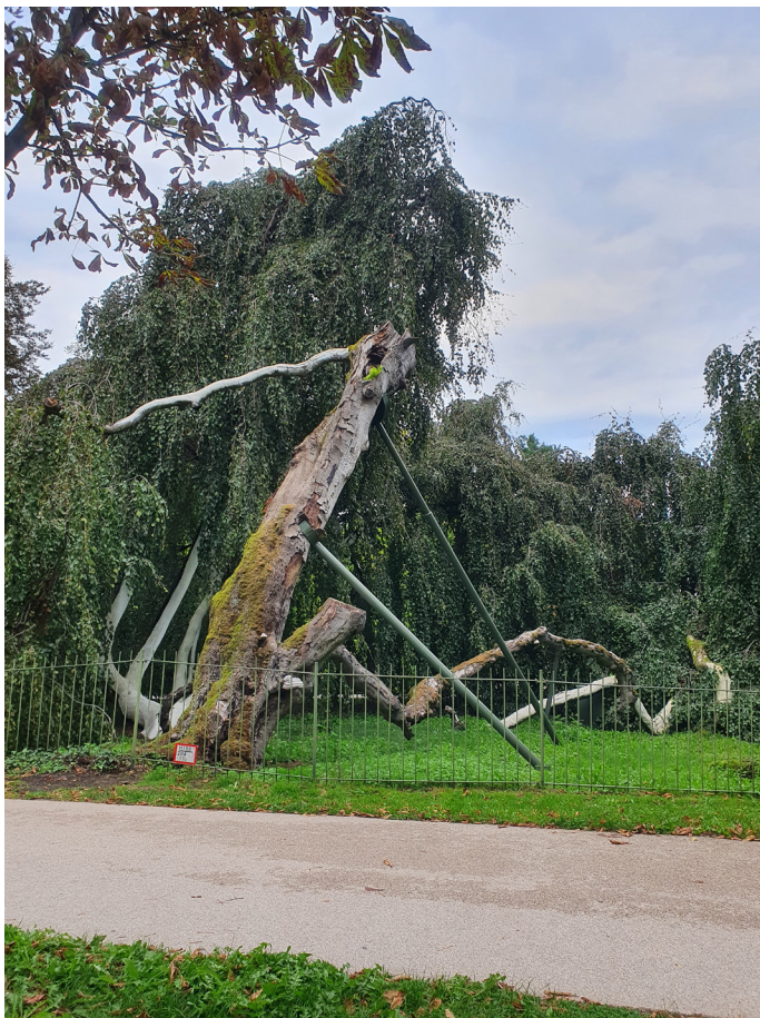
Baden Baden, Allemagne