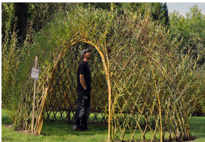
Osier etc... Cabane osier vivant