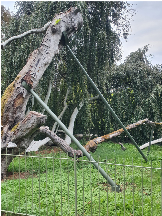
Baden Baden, Allemagne